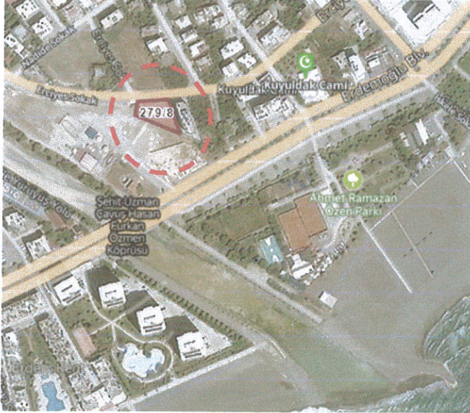
Şekil.1. Parselin konumu.

Planlama alanı konum olarak , Erdemli ilçesinin güneyinde sahil kesiminde, Alata tesislerinin batısında , Erdemoğlu Bulvarının ise yaklaşık 40 metre kuzey aksında yer almakta olup, Erciyes sokağa cephelidir.(Şekil.2)